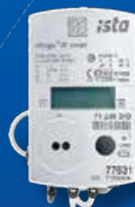
ultego III smart