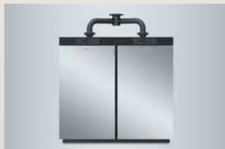
Jednoduché riešenie kaskády v jednom zariadení od 240 do 636 kW

Vitocrossal 100 je obzvlášť kompaktný plynový kondenzačný kotol s výkonom od 80 do 318 kW. Samočistiace teplovýmenné plochy z ušľachtilej nehrdzavejúcej ocele zaisťujú vysokú efektívnosť. Vďaka integrovanému cylindrickému horáku MatriX sa zdroj tepla vyznačuje veľmi tichou prevádzkou. Integrovaná regulácia spaľovania Lambda pro Control automaticky nastavuje horák na rôzne druhy plynu a ručí za vysokú kvalitu spaľovania s nízkymi emisiami. Voliteľné rozhranie Vitoconnect umožňuje komfortnú reguláciu cez aplikáciu. www.viessmann.sk